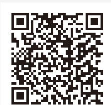
QRコードを読み取り