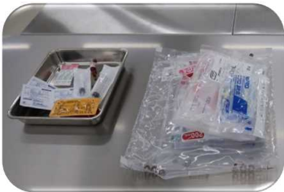
実習で使用したアンプル、バイアル、シリンジ、輸液バック等の備品