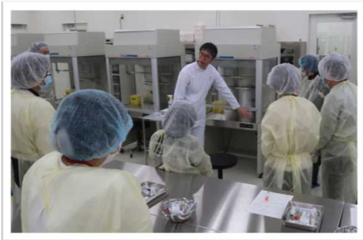
クリーンベンチの説明