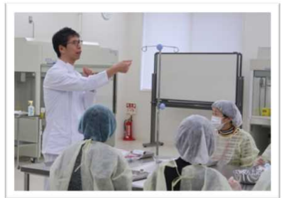
アンプルカットの説明