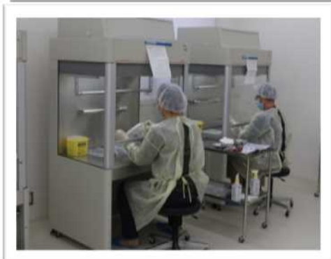
輸液の ミキシング