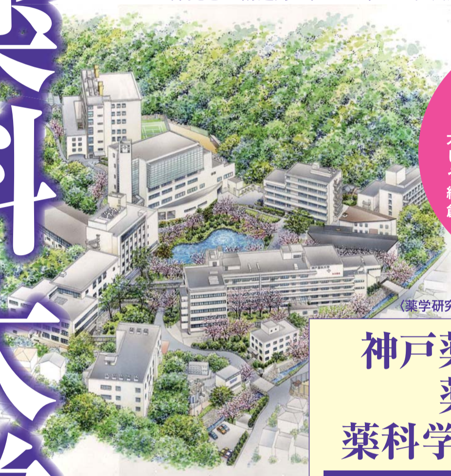
〈薬学研究科 薬科学専攻(修士課程) イメージ図〉