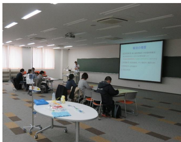
輸液の種類、電解質輸液の目的別分類、 投与した輸液がどこに行くのか？