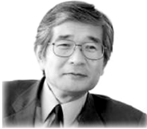
講師 順天堂大学医学部病理・腫瘍学講座教授